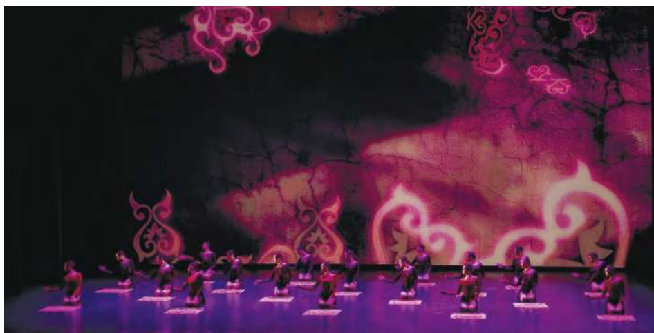
Рис.5. Национальные орнаменты в реквизитах в сценографии