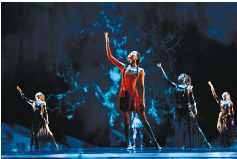
Рис.1. Видеоголограммы, световые инсталляции