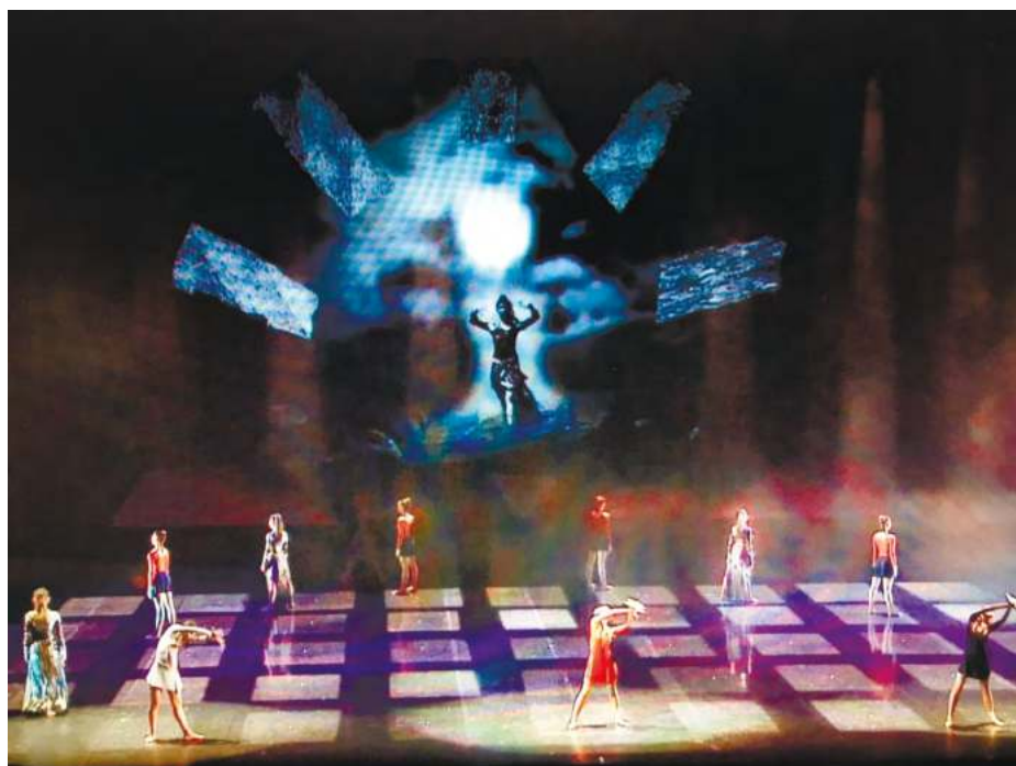
Рис.2. Видеоголограммы, дымовые инсталляции

Музыку для балета «Элем» написал композитор мультиинструменталист Булат Гафаров. Композитор, ведущий активную концертную деятельность, создал музыку для многих фильмов и театральных постановок в России, США, Канаде, Европе и Азии. В 2014 году выступал с концертами на XXII Олимпийских зимних играх в Сочи.