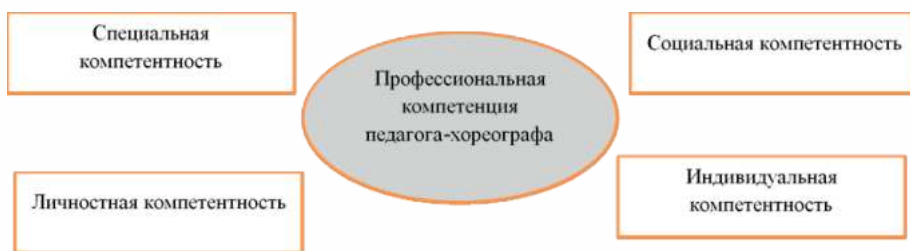
Рис. 2. Виды профессиональной компетенции педагога-хореографа. Разработано автором на основе источника [6]

Вышеназванные компетенции не единственные. Так, к примеру, С.А. Смирнов выделил такие виды профессиональной компетенции с учетом специфики деятельности педагога-хореографа (Рис. 2).