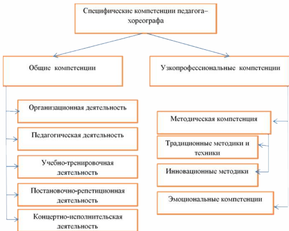
Рис. 1. Специфические компетенции педагога-хореографа. Разработано автором на основе источника [8]

Согласно мнению Л.Я. Николаевой, профессиональные компетенции педагога-хореографа, руководителя хореографического коллектива можно разделить на общие и узкопрофессиональные компетенции [8] (Рис. 1).