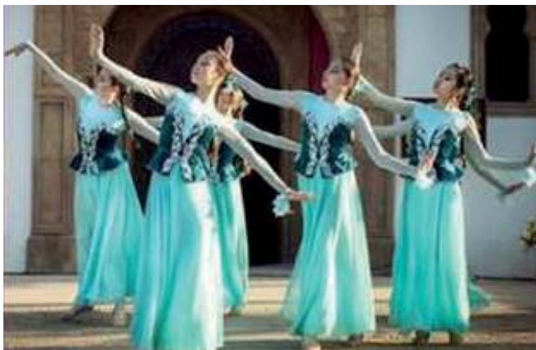
Рис. 3. Постановка «Птицы мира» на VI международном фестивале в Испании (2014 г.)