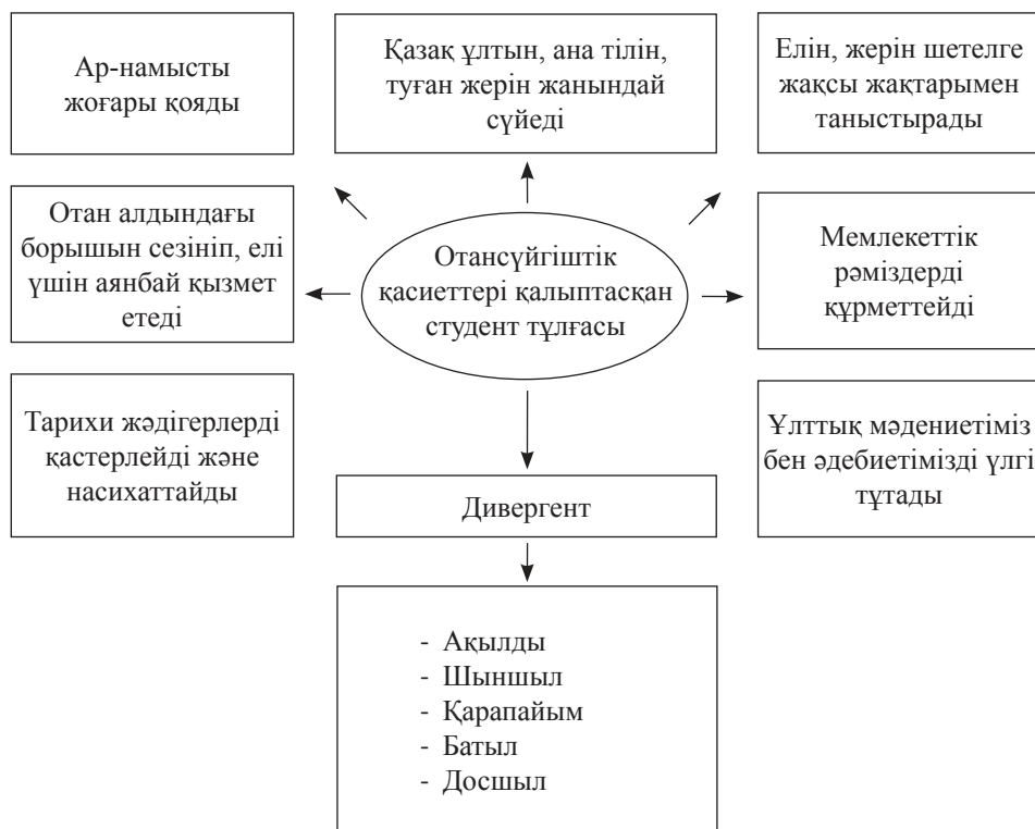
Кесте 3. Отансүйгіштік қасиеттері қалыптасқан студент тұлғасының моделі

Жоғарыдағы кестеде отансүйгіштік қасиеттерді қалыптастырудың жолдары берілсе, келесі кестеде нағыз отансүйгіш тұлғаның бойындағы асыл қасиеттерді көрсетеміз.