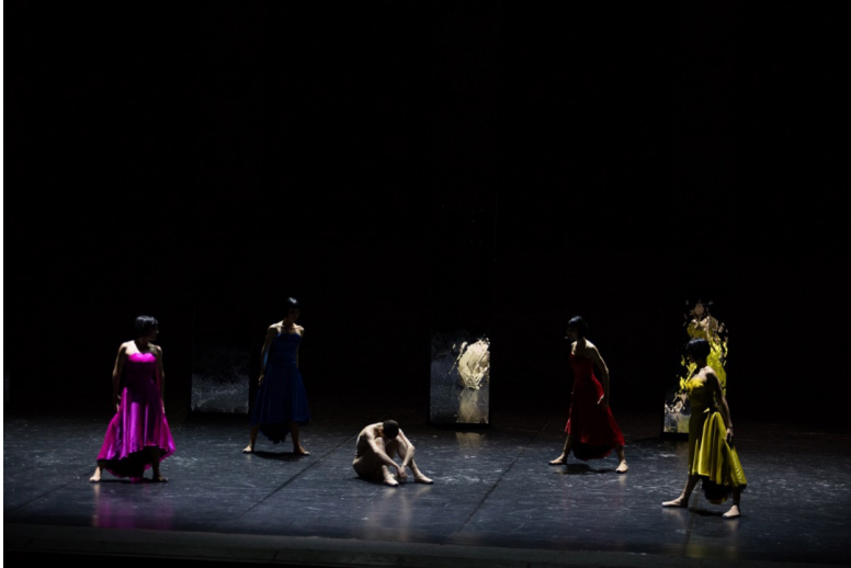
Фото 1. Сцена из балета «Кармен» М. Авахри.