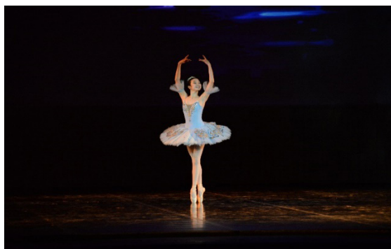
Pic 1. Name of the picture. Source of the picture