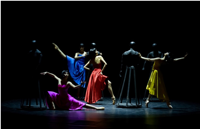
Фото 2. Сцена из балета «Кармен» М.Авахри.