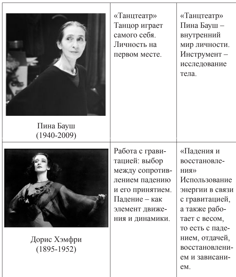
Таблица.2. Основные техники на уроках современного танца

Образование в XXI века акцентировано на творческую самореализацию личности. Проблема самореализации человека как личности присутствовала на всех этапах развития человечества, сегодня она достигла наибольшей актуальности. Это обосновано тем, что мировой прогресс возвысил человека над его индивидуальным опытом, раскрывая перед ним новые перспективы и горизонты развития творческого потенциала, его природных задатков, что является одним из важнейших условий, способствующих осуществлению самореализации личности.