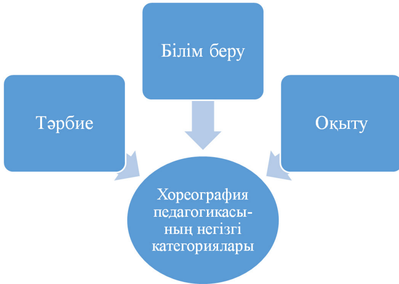
Кесте №1. Хореография педагогикасының негізгі категориялары.

Тәрбие – бишінің тұлғасын қалыптастыруға мақсатты түрде бағытталған үрдіс, балет өнері саласында жинақталған тәжірибемен бөлісу, болашақ кәсіби қызметке дайындау мақсатында оқушыға бағытты ықпал ету.