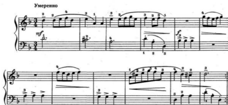
Рис.3. Л. Моцарт «Менуэт»

Некоторые методические варианты. С обучающимися хореографических школ для развития музыкальных впечатлений можно использовать метод рассказа после проигрывания какого-либо произведения педагогом. Например, можно сыграть следующее произведение: