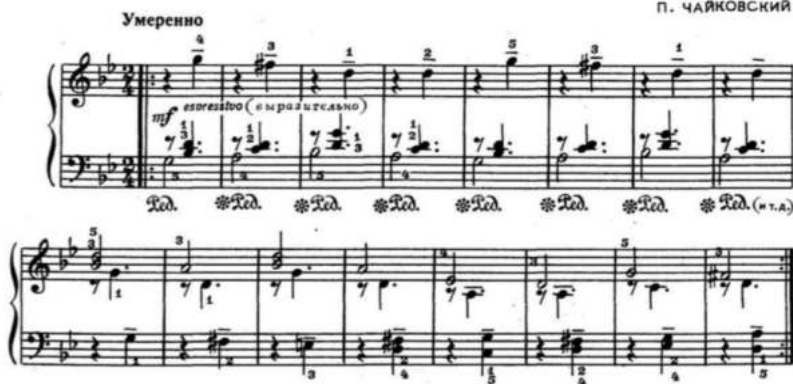
Рис.4. П. Чайковский «Болель куклы»

Также можно использовать на уроках метод живописи. Обучающийся должен понять с помощью педагога, что чем светлее музыка, тем светлее цвет и