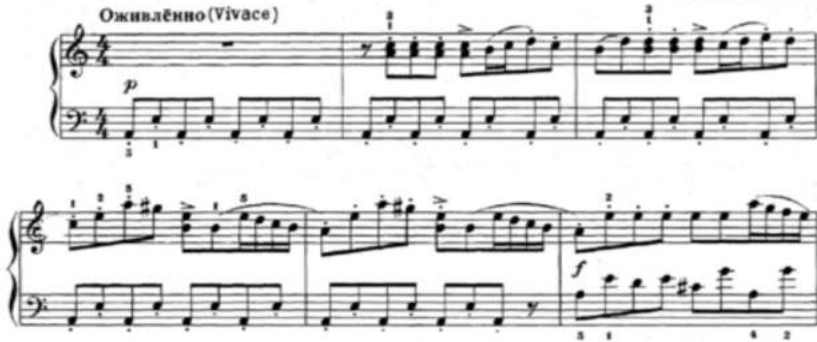
Рис.10. П.Чайковский «Танец лебедей» из балета «Лебединое озеро»

Важное место в учебном репертуаре составляет музыка композиторов Казахстана. Это произведения композиторов XX века: Е. Брусиловского, Л. Хамиди, А. Жубанова. И более современных: А. Исаковой, К. Дуйсекеева, Г. Жубановой, А. Абдинурова. Например, произведение Г. Жубановой «Легенда»: